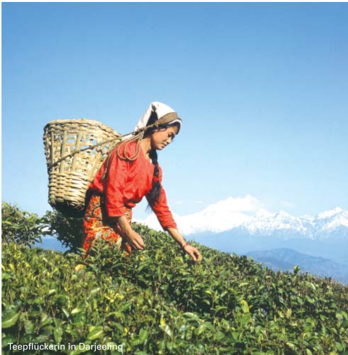
Teepflückerin in Darjeeling